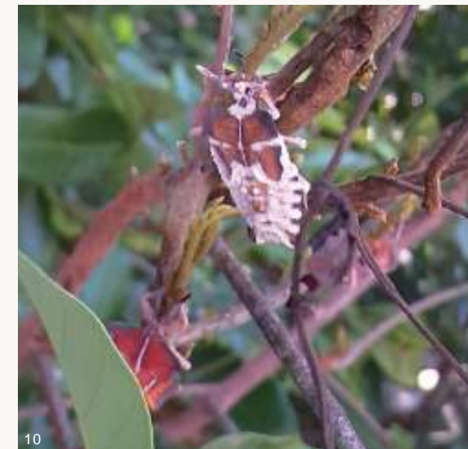
圖10~11. 108年梅雨季前後，大量荔枝椿象若蟲及成蟲感染蟲生真菌而死亡僵直掛在樹上，蟲體內白色黴菌從觸角、足、胸腹部等節間或氣孔、臭腺開孔長出。

寒流，荔枝及龍眼開花量豐，龍眼蜜產量足，但荔枝椿象族群密度也較高。相對的，108年首兩月平均日溫超過16°C為暖冬，無寒流，致使荔枝、龍眼開花結果少而歉收，龍眼蜜也幾乎無收，又加上108年梅雨季前後雨量充沛，若蟲及成蟲個體感染蟲生真菌死亡情形增加，使得該(108)年度荔枝椿象族群數量亦受到衝擊而大幅減少，與107年4~12月同期龍眼樹上荔枝椿象成蟲族群數量具明顯差異。