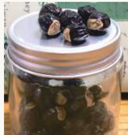
圖3. 龍眼果實似龍目，古詩云「圓如驪珠，赤若金丸，肉似玻璃，核如黑漆」。