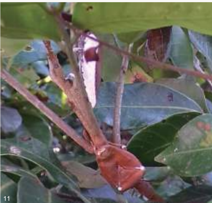
圖10~11. 108年梅雨季前後，大量荔枝椿象若蟲及成蟲感染蟲生真菌而死亡僵直掛在樹上，蟲體內白色黴菌從觸角、足、胸腹部等節間或氣孔、臭腺開孔長出。