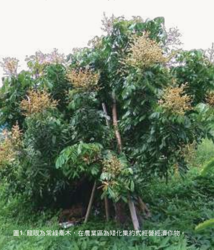
圖1. 龍眼為常綠喬木，在農業區為矮化集約式經營經濟作物。

荔枝椿象( Tessaratoma papillosa )屬半翅目(Hemiptera)、荔枝科(Tessaratomidae)，為荔枝及龍眼常見的害蟲，分布於泰國、越南、寮國、香港及中國等地，遲至1997年首次在金門發現，2009年則首次在臺灣高雄發現，目前除澎湖縣尚未發現、臺東縣、花蓮縣零星分布外，已經在臺灣各縣市普遍發生，其寄主植物主要為無患子科(Sapindaceae)植物包含荔枝( Litchi chinensis )、龍眼( Dimocarpus longan )、無患子( Sapindus mukorossi )及臺灣欒樹( Koelreuteria henryi )等四種喬木。