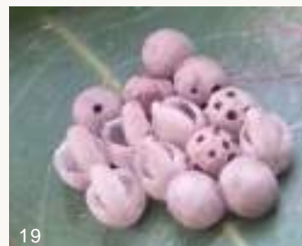
圖18~19. 龍眼葉背一批荔枝椿象卵，旁邊正有一隻平腹小蜂虎視眈眈地準備寄生（上圖）。14顆荔枝椿象卵（下圖），其中有6顆縱裂者為正常孵化成荔枝椿象一齡若蟲爬走，有4顆卵則每卵有1~7個圓孔，表示已經被跳小蜂寄生且羽化為小蜂成蟲飛離，另4顆則尚未孵化或羽化。