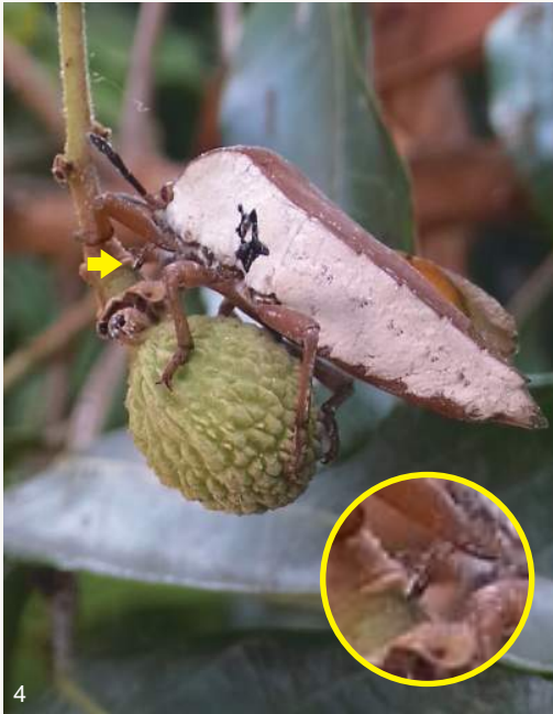
圖6~7. 大量椿象成蟲或若蟲集中刺吸樹汁，雖不致造成植株死亡，但常造成局部枝條枯萎，並將可能影響果實收成。

圖4~5. 龍眼大約在二月底至五月抽紅嫩枝葉並開花結幼果，常吸引荔枝椿象前來交配或吸汁，荔枝椿象粗短口針多直接插入花芽、葉芽、嫩枝、花柄或果柄，而非刺進花果或樹幹。