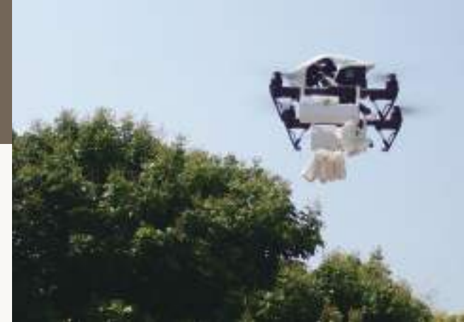
圖20. 利用無人機投放平腹小蜂卵片，進行生物防治，殺死荔枝椿象卵。