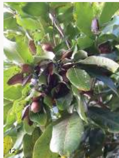
圖12~13. 荔枝椿象在龍眼葉下聚集越冬，此時進入生殖系統發育停止或緩慢的繁殖滯育期，此時不太活動，在樹下通常聞不到椿象臭味。

在臺灣，無患子與臺灣欒樹從10月開始漸漸枝葉稀疏，新羽化的荔枝椿象並不交配，漸漸飛離，銷聲匿跡。有部分可能分散飛至不明處所躲藏，然而它們曾被發現聚集在龍眼樹的葉背，且以成蟲方式度過日照漸短的秋冬。一般人在龍眼樹下也以為荔枝椿象都飛走了，因為此時已聞不到椿象臭味。