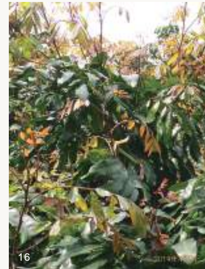
圖16~17. 龍眼葉芽如正常生長，應該會長出許多紅嫩枝葉（上圖）並正常展開逐漸變青綠。但如果發生鬼帚病（下圖），則葉芽無法展開，且組織增生長毛呈現簇生狀乾枯情形，開花率亦會降低。

高雄大崗山一帶地區龍眼鬼帚病相當普遍，惟截至目前為止仍無法證實此病徵為荔枝椿象媒介不明病原造成；然而卻有愈來愈多證據顯示可能是因為節蟬數量暴增取食汁液，而使龍眼葉芽組織變形增生枯萎，導致樹葉無法展開且開花率降低。