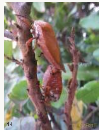
圖14~15. 一般來說，荔枝椿象通常喜歡在枝條或花葉芽上直立式交配，上方的雌蟲仍然邊交配邊吸樹汁（上圖）；剛打破越冬後在龍眼葉下水平式交配的情形則極為罕見（下圖）。